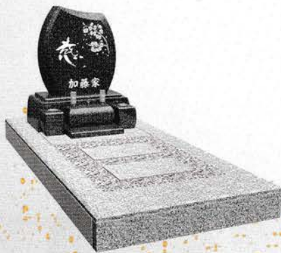
白御影+グレー御影 価格 564,000円 (税込)

価格 墓石代 墓地使用料(土地代) 236,500円+234,000円 =470,500円 (税込) 墓所使用料(土地代) 基礎代 墓石代含む