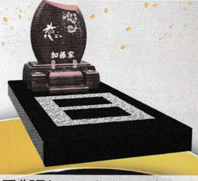
黒御影+ライチレッド 価格 674,000円 (税込)