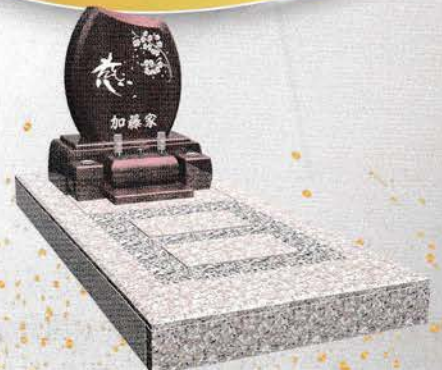
桜御影+ライチレッド 価格 630,000円 (税込)