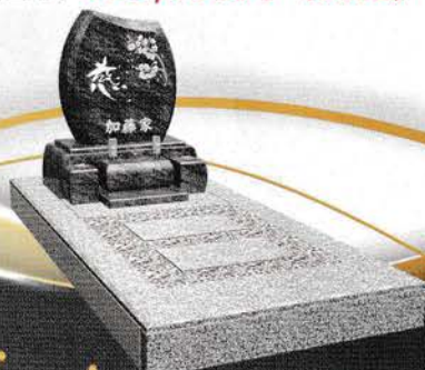
白御影+バハマブルー 価格 608,000円 (税込)