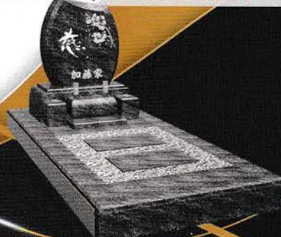
バハマブルー 価格 652,000円 (税込)