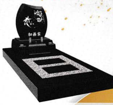
黒御影 価格 674,000円 (税込)