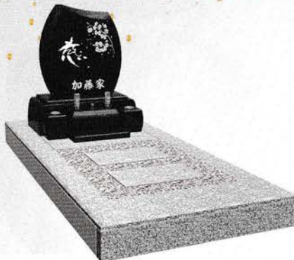
白御影+インドブラック 価格 619,000円 (税込)