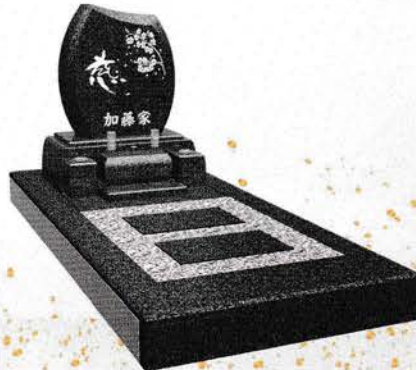
グレー御影 価格 586,000 (税込)