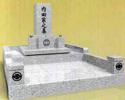
外柵石+門柱外柵+土間張石 価格1,175,000円 (税別)