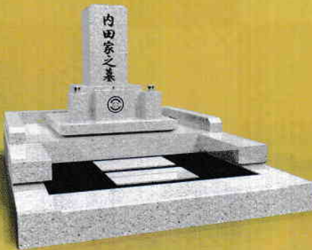
B 外柵石+物置台2個 価格 1,005,000円 (税別)