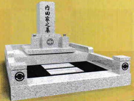
C 外柵石+門柱外柵石 価格 1,115,000円 (税別)