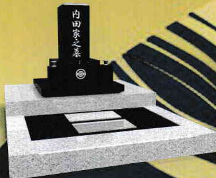
黒御影タイプ 価格 1,150,000円 (税別)