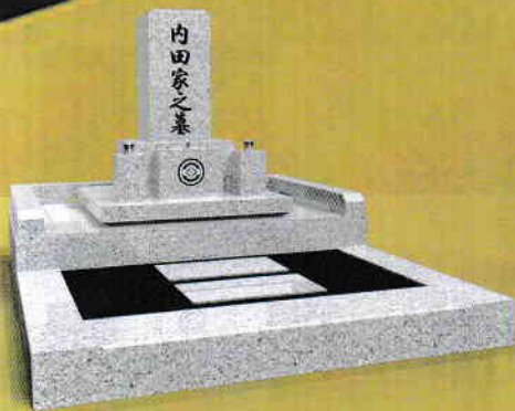
A 外柵石 追加タイプ 価格 945,000円 (税別)