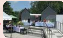
「永遠之丘」納骨法要